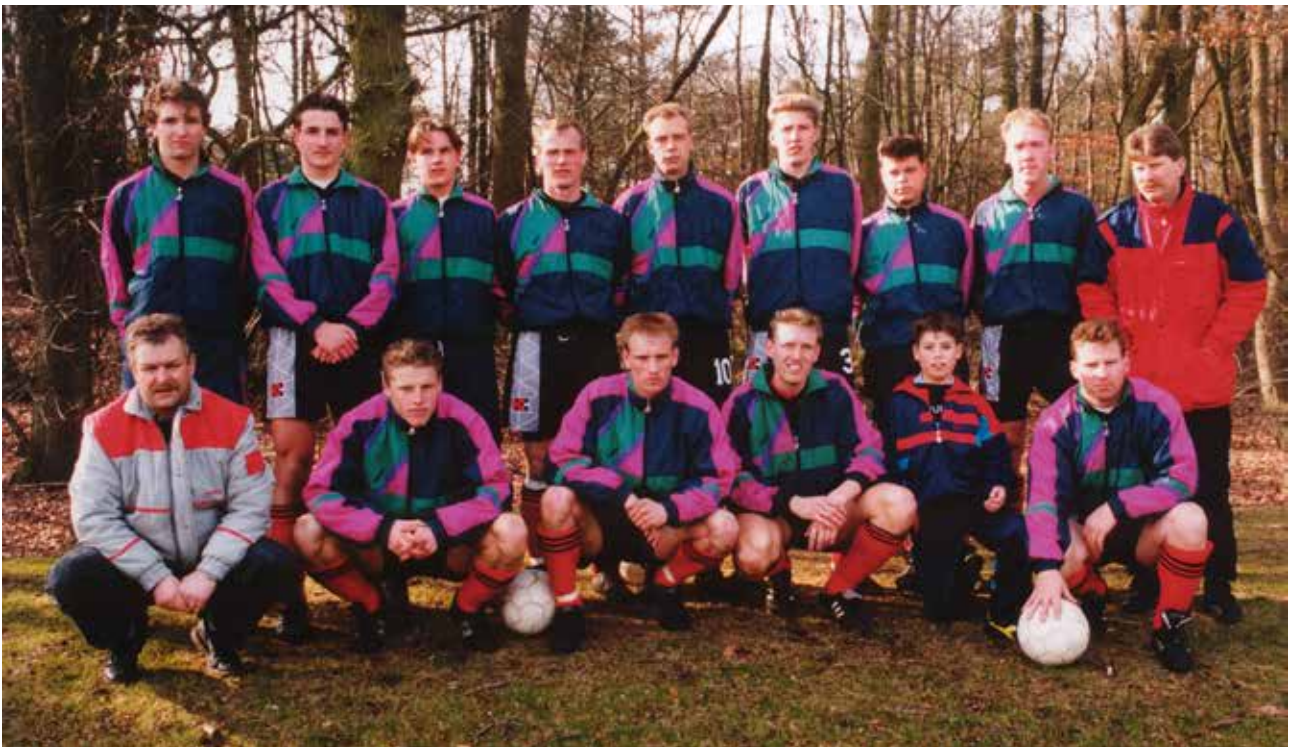
Selectie DES 1 seizoen 1993-1994