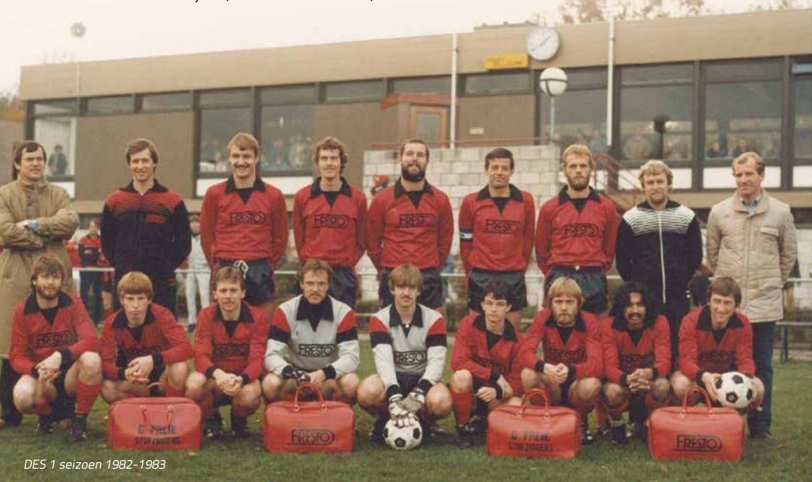
DES 1 seizoen 1982-1983